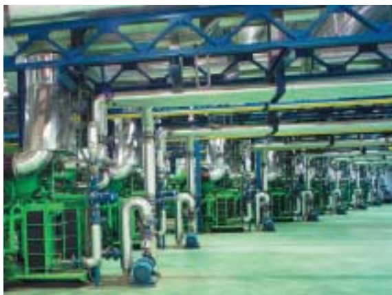
Jenbacher-BHKW in Koipe, Spanien

oder Bio-Gasen betrieben werden, bedürfen einer sorgfältigen Überwachung, denn sie sind nicht nur extremen Belastungen ausgesetzt. Probleme werden vor allem verursacht durch eine stark schwankende Zusammensetzung und Verunreinigungen der Gase. All dies schlägt unmittelbar auf den Zustand des Gasmotorenöls durch. Mit einer regelmäßigen Vollanalyse des Öls, das solche Verunreinigungen zu neutralisieren hat, werden die Probleme rechtzeitig erkannt. Dank der Analysenwerte in Verbindung mit dem entsprechenden Know-how der Techniker können gasartbedingte Risiken eliminiert werden.