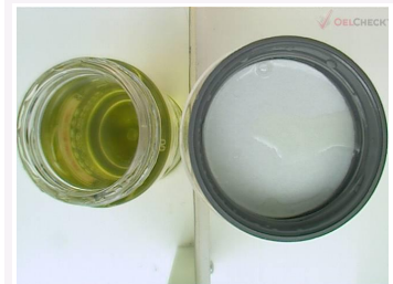
Probe und Deckel