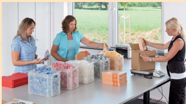
Schnell, sauber & zuverlässig – die OELCHECK-Versandabteilung stellt die individuellen Bestellungen der Analysensets für Sie zusammen.

Nur wenn eine Probe zeitnah untersucht wird, können Sie von den wertvollen Vorteilen unserer Schmierstoff-Analysen profitieren, Ölwechsel in Abhängigkeit des Zustands durchführen und etwaige drohende Schäden im Vorfeld entdecken.