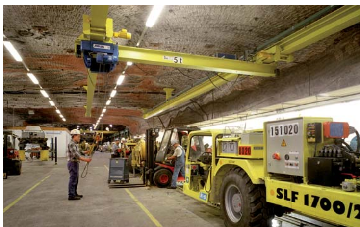
In der 20.000 m 2 großen Werkstatt werden die Geräte unter Tage gewartet und repariert.

Mit dem Förderkorb geht es für die Instandhalter des Grubenfeldes Hattorf-Wintershall der K + S KALI GmbH in ihre riesige Werkstatt unter Tage. Ihr Arbeitsplatz liegt 750 m unter der Erdoberfläche. Hier warten und pflegen etwa 125 Mitarbeiter mehr als 1.000 Maschinen, die aktuell im Grubenfeld im Einsatz sind. Gearbeitet wird rund um die Uhr im Dreischichtbetrieb.