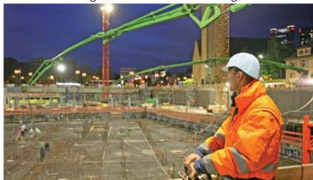
Putzmeister Autobetonpumpen in Aktion beim Bau des Frankfurt Towers.

Ab September 2012 wird die M 42-5 auf den Baustellen, u.a. für den Stadionbau, im heißen Klima von Katar unterwegs sein. Als Vorbereitung dafür laufen