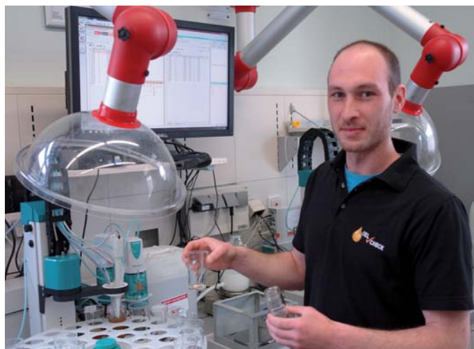
Messung der Neutralisationszahl für Kältemaschinenöle im OELCHECK-Labor

Die einzelnen Prozessschritte wurden für Kältemaschinenöle neu konzipiert. Es wird unmittelbar bei der ersten Öffnung des Probengefäßes eine Teilmenge von max. 5 g entnommen. Damit wird der Wassergehalt präzise nach der Karl Fischer Methode ermittelt. Für die Bestimmung der weiteren Werte müssen die in der Probe enthaltenen Anteile von Kältemitteln entfernt werden. Die geöffneten Probengefäße werden dazu in eine gasdichte Vorrichtung eingespannt. Nach Erwärmen der Proben auf 80°C strömt so lange Inertgas durch das Öl, bis kein Kältemittel mehr im Abluftstrom nachgewiesen werden kann. Erst nach diesem über eine Stunde dauernden Prozess ist die Probe startklar für die weiteren umfangreichen Laboruntersuchungen.