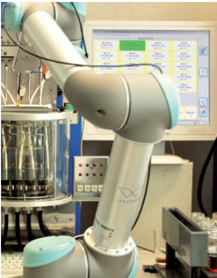
Der neue Viskositätsroboter im Einsatz

Die Viskosität ist der wichtigste physikalische Kennwert eines Öles oder einer Hydraulikflüssigkeit überhaupt. Sie beschreibt die Fließeigenschaften des Öls und ist verantwortlich für dessen Fähigkeit, Oberflächen durch den Aufbau eines hydrodynamischen Schmierfilms vor Verschleiß zu schützen. Die Bestimmung der Viskosität bei 40 und 100°C ist ein fester Bestandteil des Analysenumfanges für jedes OELCHECK-Analysenset. Da sich die Viskosität in Abhängigkeit von der Temperatur ändert, wird zweimal gemessen.