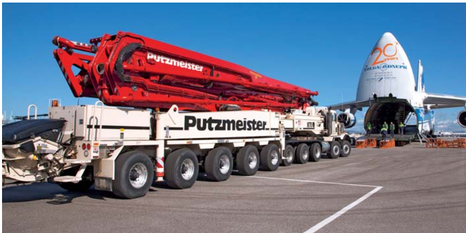
Beim Störfall des Atomkraftwerks in Fukushima übernahmen Putzmeister Autobetonpumpen die Kühlung von außen. Für den Transport der weltweit größten Autobetonpumpe wurden Antonov Großraumflugzeuge eingesetzt.

Als es im März 2011 im japanischen Kernkraftwerk Fukushima zur Katastrophe kam, hielt die Welt den Atem an. Die Kühlung von außen war ein letzter verzweifelter Rettungsversuch, den drohenden GAU aufzuhalten. Der Erfolg schien ungewiss, doch fünf Putzmeister Autobetonpumpen machten das fast Unmögliche möglich. Dabei stand von Anfang an fest: Nur die Spezialpumpen von Putzmeister können helfen. Schließlich baut das deutsche Unternehmen aus Aichtal bei Stuttgart mit der M 70-5 die größte Autobetonpumpe der Welt mit einem Verteilermast von bis zu 70 m Reichhöhe. Den Transport nach Japan übernahmen Antonov Großraumflugzeuge. Mit den Autobetonpumpen konnte dann das Kühlwasser zielgenau über die zerstörten Gebäude eingebracht werden.