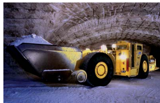
Mit Radladern wird das durch Sprengen gelockerte Rohsalz zu den Brechern transportiert. Die K+S KALI GmbH produziert in Deutschland jährlich 8 Millionen Tonnen Kali-Düngemittel.

Betriebsstunden eine Begutachtung durch die Instandhaltungs-Experten fällig. Schmierstoff-Analysen von OELCHECK gehören dabei zu ihrem täglichen Handwerkszeug. Alle 500 Betriebsstunden wird das Hydrauliköl der großen Lader geprüft.